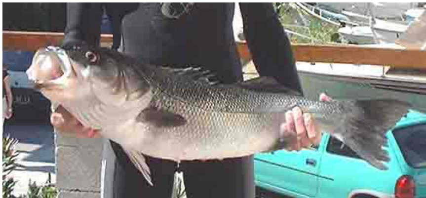
Mimi le muge

Je suis chasseur, mais j'ai aussi beaucoup de respect pour ces êtres qui me procurent tant de sensations et émotions fortes.