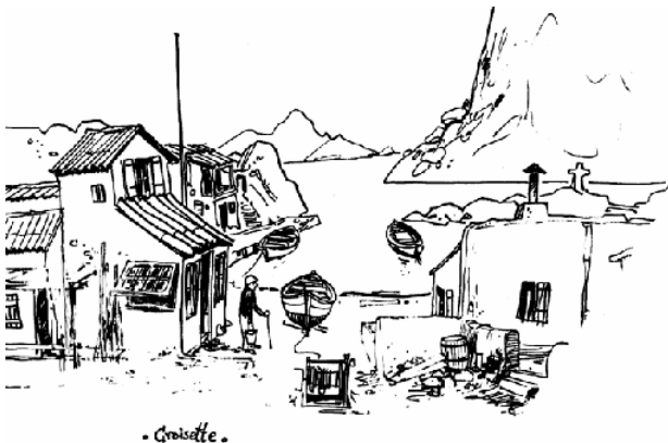
« Croisette »