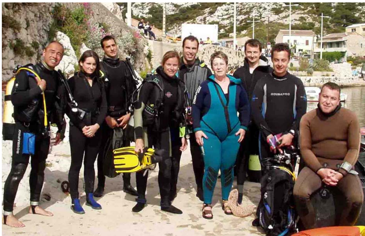
Retour de plongée d'une partie des stagiaires et encadrants

Marseille-Sports Loisirs Culture Siège Social 146A Avenue de Toulon 13010 -Marseille -