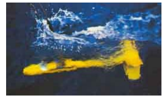
* Tracté quelques mètres au dessus du fond, le « poisson » permet l'impression zone de fond de 200mètres de large sur le sondeur latéral.