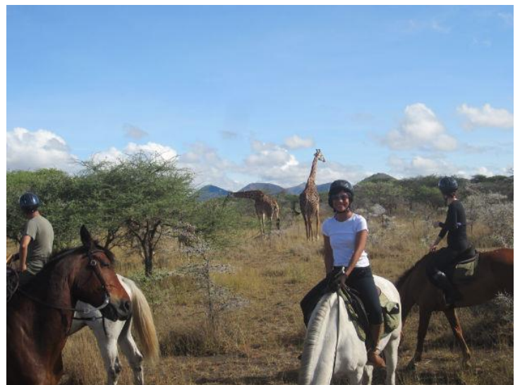
De jolies girafes

Ma dernière occupation est la randonnée à cheval. Enfin j'essaye. Il y a beaucoup de chevaux au Kenya et pas mal de safari à canasson. C'est idéal pour approcher les animaux, car ils n'ont pas peur des chevaux et j'imagine que c'est plus sécurisant. Le seul problème est le prix, car c'est toujours du grand luxe pour américains. Heureusement, avec les élections et la saison des pluies, ils font des prix pour les résidents. On en a profité avec quelques camarades cavaliers pour tenter l'expérience. Phénoménal. Imaginez un réveil à l'aube et une ballade au milieu du bush à pister les animaux. Un petit galop pour se réveiller et soudain au détour d'un virage, vous surprenez quelques girafes qui abandonnent leur déjeuner de feuilles et d'épines pour s'enfuir à l'amble. Comme vous êtes déjà au galop, vous accélérez et votre cheval vous suit. Voilà, vous y êtes. Fatigué ?