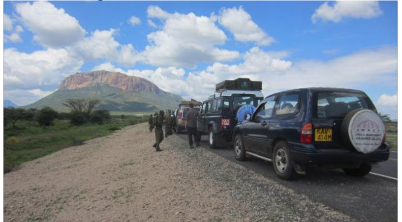
Trouvez le requin baleine

Voilà un nom qui devrait éveiller l'intérêt de plus d'un morse : le requin baleine, un must pour ceux qui l'ont vu, un mythe pour les autres. Vous allez déchanter car ce n'est pas ce que vous croyez. Il y a bien des requins baleines au Kenya, mais je n'en ai pas vu (encore !). Non, le "Requin baleine" ou mieux le "Whale shark", c'est le nom que j'ai donné à ma land rover toute neuve. Enfin, elle a déjà quelques kilomètres au compteur car je ne la ménage pas. Bleue avec un toit blanc, il ne lui manque plus que des points blancs un peu partout pour ressembler à un requin baleine. J'hésite à sauter le pas car comme elle est, elle a la couleur des lands de la