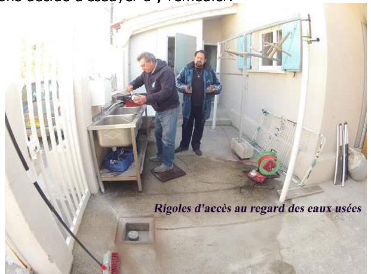
Rigoles d'accès au regard des eaux usées

Après ces essais, nous décidons d'un commun accord de faire deux trous d'accès au regard d'écoulement des eaux usées, qui se trouve devant la porte d'entrée et faire deux rigoles, pour canaliser le flot ininterrompu de l'eau de rinçage au retour des Morses plongeurs.