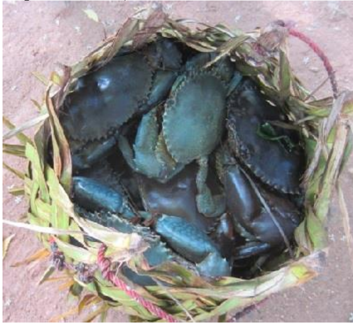
A table, le plus gros est pour moi !

Le lendemain, c'est déjà dimanche et il me faut reprendre l'avion le soir, donc pas de plongée. Je regarde les camarades se préparaient avec une certaine jalousie. Pour moi ce sera apnée uniquement. Cette fois nous sommes dans le parc marin, les poissons sont plus gros et moins farouches, beaucoup de mérou de différentes espèces, y compris des marbrés de belle taille. Une tortue que j'essaye d'attraper mais que j'arrive juste à toucher du doigt. Et voilà que le capitaine du boutre me signale dans de grands mouvements de bras des dauphins à tribord. Je mets le turbo et fait le tour du bateau et me voilà au beau milieu d'une groupe d'une dizaine de dauphins. Ils n'ont vraiment pas peur de nous et s'amuse entre eux comme des fous. Je les vois à cinq mètres de fonds faire des cabrioles, se mettre