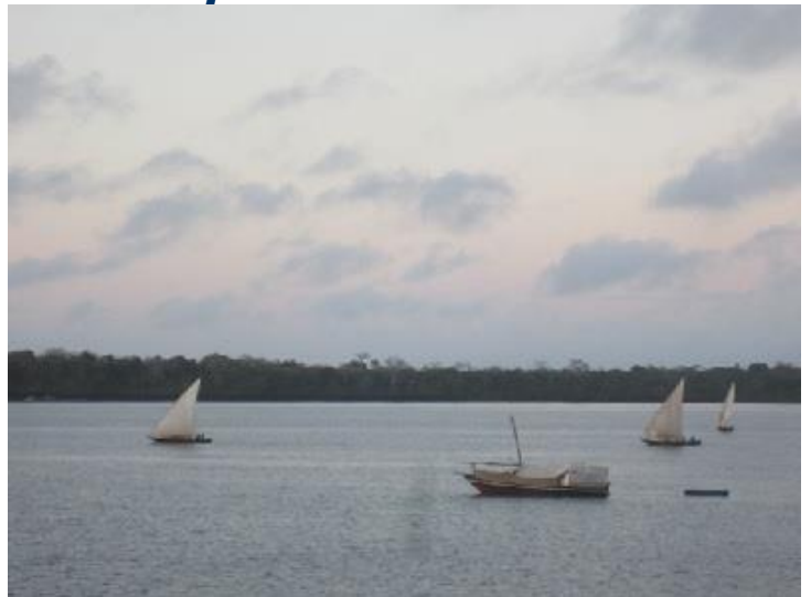
La vie trépidante des tropiques

J'imagine que vous avez votre dose de pointus et de sardines, aussi je me suis dit qu'il était temps de vous distraire avec une histoire de boutres et de dauphins. C'est vendredi, le week-end approche. Chance, le club de plongée de Nairobi a organisé une sortie à Shimoni, porte d'accès au parc marin de Wasini Island. Il paraît que c'est un des meilleurs endroits de plongée au Kenya, donc je m'inscris ! Tout commence par un petit coucou qui d'un coup d'aile nous emmène sur la côte. Sympathique : il faut partir de Wilson airport et non pas du grand aéroport international. Il est tout proche de mon bureau et il n'y a pas tout cet arsenal sécuritaire qui nous oblige pratiquement à nous mettre en sous vêtement pour monter dans l'avion. Oui, c'est déjà des vacances.