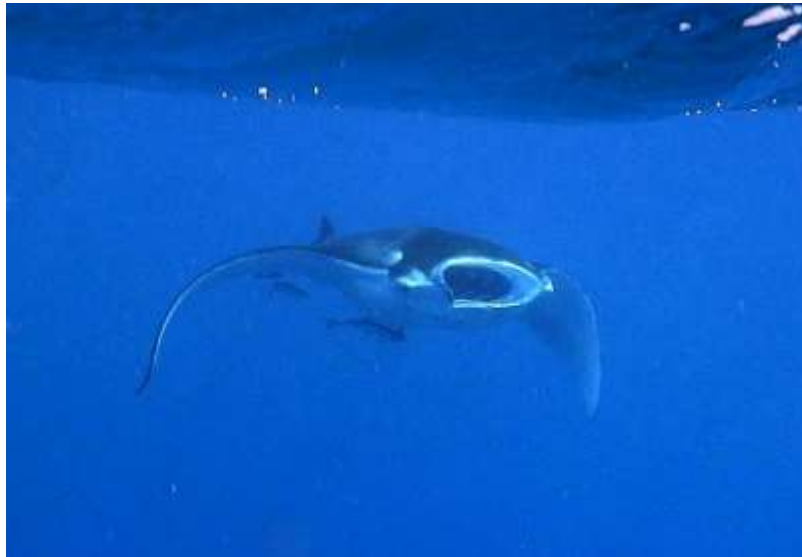
La tête de Goinfre