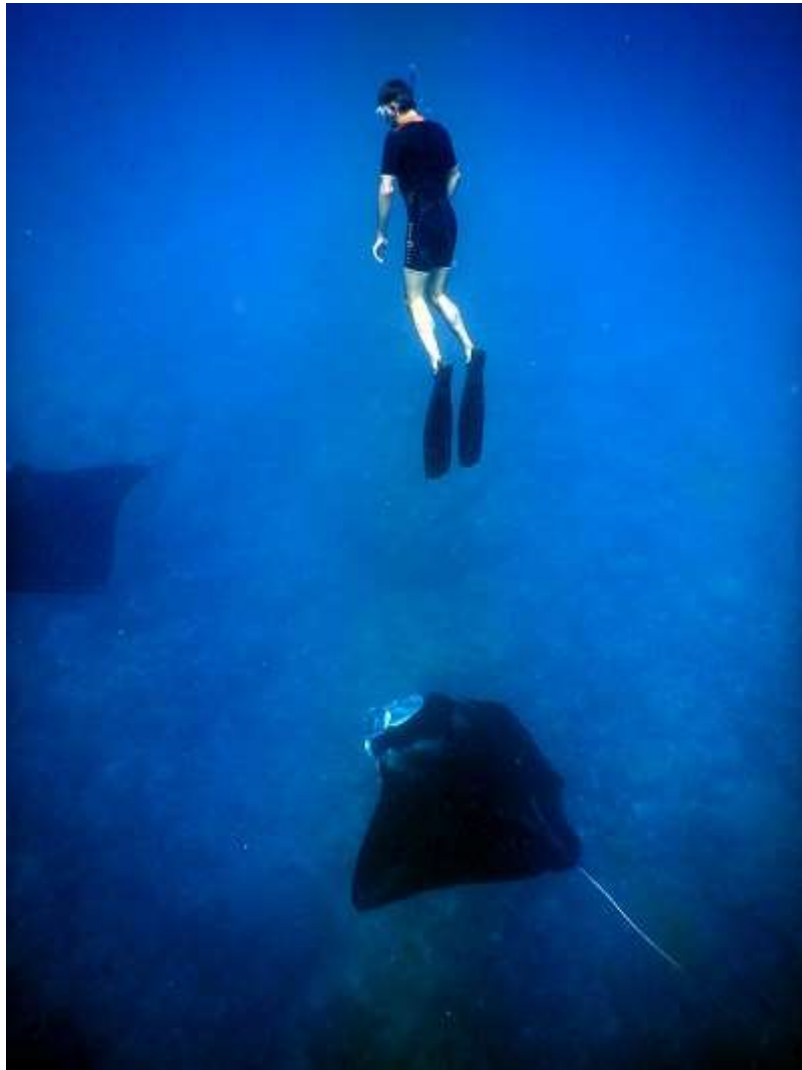
Après le grand blond avec une chaussure noire, le grand bleu avec deux mantas

Et puis aussi, cette fois sans toucher, mais juste à frôler de la main l'aile. Le plus impressionnant est que l'on sent la vitesse de l'eau qui circule sur l'extrados. Pas étonnant qu'elles semblent se déplacer sans effort mais avec autant de vélocité. Heureusement que j'ai de grandes palmes. Avant d'énerver tout le monde avec ma chance, je préfère conclure sur cette jolie photo.