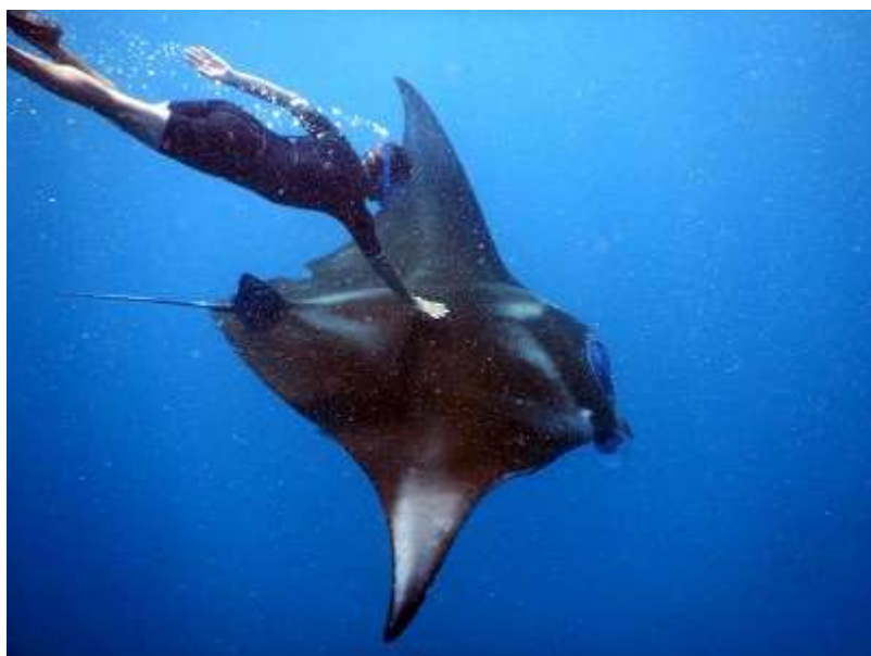
« Serrer la main à Saint Pierre » (citation de Thierry Paolucci)

Et puis aussi, cette fois sans toucher, mais juste à frôler de la main l'aile. Le plus impressionnant est que l'on sent la vitesse de l'eau qui circule sur l'extrados. Pas étonnant qu'elles semblent se déplacer sans effort mais avec autant de vélocité. Heureusement que j'ai de grandes palmes. Avant d'énerver tout le monde avec ma chance, je préfère conclure sur cette jolie photo.