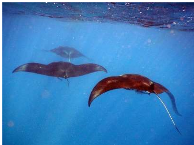
Opéra Mantas

Alors, je me laisse griser et gagner par l'idée d'approcher ces paisibles géantes en apnée. Quelques secondes de ventilation et c'est parti pour une première apnée. Je n'ai plus trop l'habitude et elles me semblent bien profondes. Mais avec l'adrénaline, tout se passe bien et si je remonte, c'est surtout pour ne pas prendre de risque.