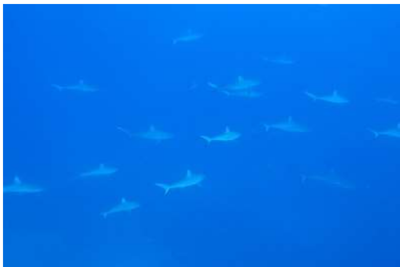
Papier peint motif requins

Le rentrant sur l'éperon, c'est la promesse d'une eau transparente et d'une très belle visibilité. Heureusement, car les requins stationnent comme suspendus dans le vide parfois assez loin du récif, entre dix et 30 mètres peut être. Si le courant est fort, c'est impossible de les rejoindre, tout du moins sans consommer un peu d'air et faire un nuage de bulles, ce dont ils ont horreur. Alors ils se décalent et vous vous retrouvez seul. Il suffit de revenir se cacher sur le récif sans respirer et les voilà qui réapparaissent après quelques minutes. Le spectacle est si fascinant que l'on peut rester un bon quart d'heure sans bouger à essayer de retenir ses respirations pour se faire le plus discret possible. La vraie limite devient la lente accumulation des temps de palier actualisé par l'ordinateur. Mais pour celui qui sait patienter, c'est parfois le gros lot : un grand requin marteau comme cela m'est arrivé une fois qui surgit des grands fonds. Les gris s'écartent pour lui laisser la place, le marteau s'approche pour satisfaire sa curiosité. Cela ne dure que quelques secondes mais l'image du banc de gris et du marteau s'est imprimée dans votre cerveau.