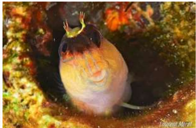
Moi j'ai eu le temps de faire une belle photo d'un chapon pas du tout farouche.